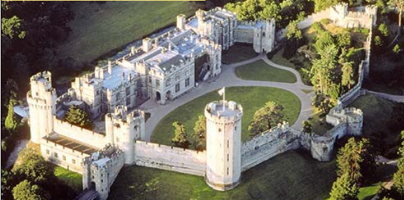
صورة قلعة وارك

إن برمنجهام ليست مدينة تتميز بالنشاط وبالمنظرة المستقبلية فحسب ولكنها أيضاً بوابة الدخول إلى المناطق المجاورة. فمن الممكن مشاهدة تراث المنطقة في المدن التاريخية القريبة مثل ستراتفورد مسقط رأس شكسبير ووارك بينما تعبر مدن مثل آيرنبردج جورش التي شهدت مولد الثورة الصناعية ومصانع الفخار في ودجوود وروبال دولتون عن تاريخنا الصناعي.