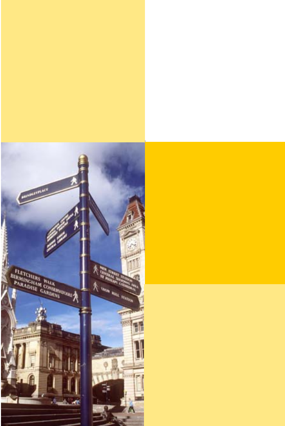
صورة ميدان تشمبرلن

أخذت المجهودات الحديثة لتجديد شباب المدينة شكل إعادة تصميم المناطق العامة حيث تم